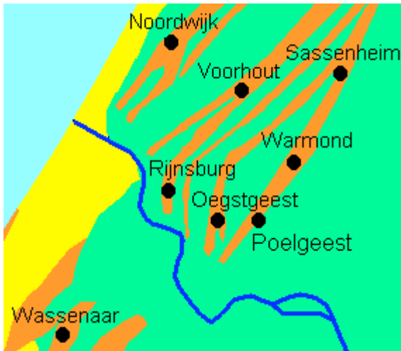
De strandwallen (bruin) met de Rijn (donkerblauw) en de Noordzee (lichtblauw).

Zo'n 7000 jaar geleden, kort na de laatste ijstijd, lag Oegstgeest bij wijze van spreken nog in zee. De kustlijn lag toen ter hoogte van waar nu kasteel Oud-Poelgeest ligt. Omstreeks die tijd kwamen er enorme hoeveelheden zand en dergelijke via de Rijn in zee terecht, afkomstig van de gletsjers in de Alpen. De zee legde dat zand voor de kust. Steeds opnieuw ontstond er eerst een zandbank, daarna strand en daarna, door opstuiving met duinen, een strandwal. Zo schoof de kust almaar verder richting zee. De eerdere stranden kwamen met hun duinen in het land te liggen als de strandwallen die wij nu nog kennen.