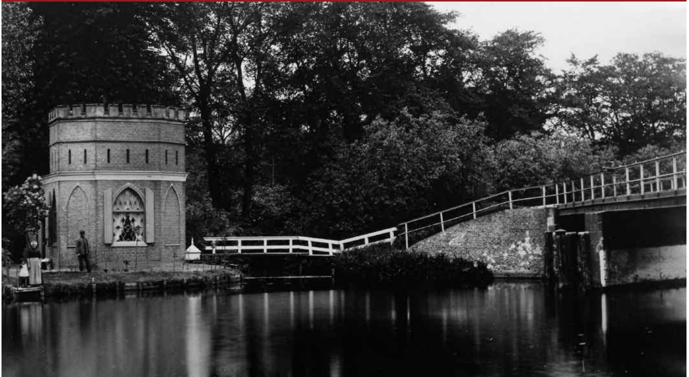
Kwaakbrug met kapel van kasteel Oud-Poelgeest rond 1900 (GaO nr. G00072). Kennelijk werd de kapel toen niet meer als zodanig gebruikt maar bewoond door de jager, wellicht de man op de foto, reden waarom men ook wel spreekt van 'het jagershuisje.' Kapel en brug waren door middel van een houten bruggetje met elkaar verbonden. Zie ook de op de voorkant afgedrukte prentbriefkaart.