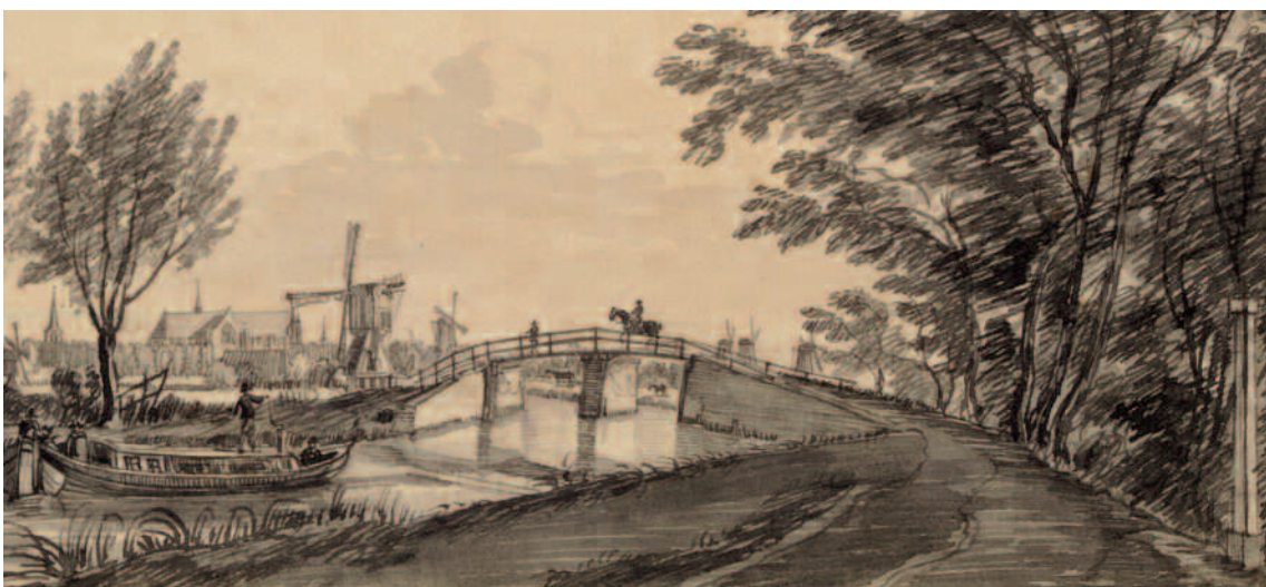
De Kwaakbrug na 1660 met links een trekschuit en op de brug de jager. Rechts ligt, niet zichtbaar, kasteel Oud-Poelgeest en op de achtergrond ligt Leiden. Detail Jan de Beyer (toegeschreven), Gezicht op Leiden vanuit het noorden, gewassen tekening in Oost-Indische inkt, Leiden 1750 (RAL, PV 1703, detail).

Al in 1660 is de eerste brug uit 1657 langer gemaakt door hem te voorzien van een middenpijler, waarbij het dek ook breder is gemaakt. 6 Op onderstaande tekening uit circa 1750 is de situatie van toen te zien.